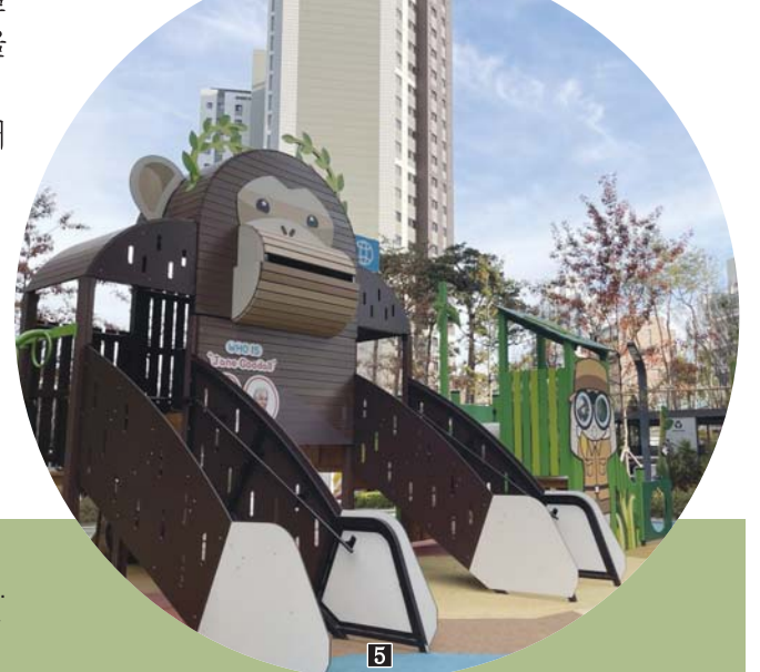
1 조각상 '에너지, 생동하는 생명체 SH 25-01'. 2 연못과 예술작품으로 꾸민 갤러리아아트rium. 3 '학자수' 회화나무가 식재된 힐링복가든. 4 단지 내 돌 조각상. 5 침팬지 테마의 놀이터.