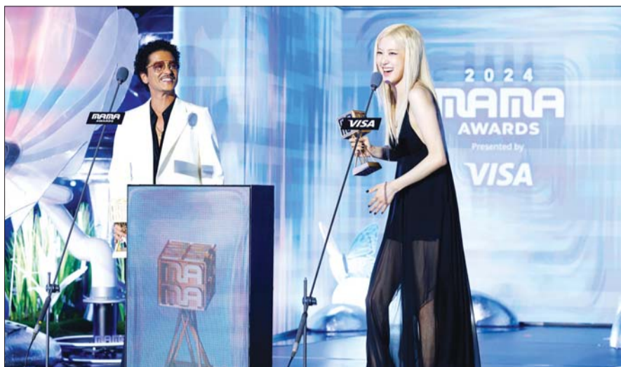
‘아파트’로 영미권 차트를 강타한 미국 팝스타 브루노 마스와 그룹 ‘블랙핑크’ 멤버 로제가 22일 오후 일본 교세라 돔 오사카에서 열린 ‘2024 마마 어워즈(MAMA AWARDS)’에서 ‘글로벌 센세이션’을 받았다.

24일 한국거래소에 따르면 코스피는 지난주 초부터 반등을 시작해 2500선을 탈환했지만 지난 9월 4일 이후로 2600선을 뚫지 못하는 ‘박스권’에 머물러 있다. 반면 22일(현지시간) 뉴욕증시의 S&P 500 지수는 지난주 약 1.3% 상승하며 올해 상승률만 24%를 넘어섰고, 다우 지수는 사상 최고치(4만4296.51)를 경신했다. 이에 국내 투자자들은 해외 주식으로 빠르게 투자자금을 옮기는 모양새다.