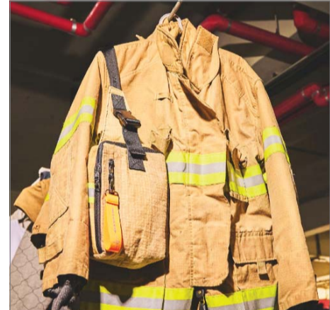
방화복과 방화복 업사이클링으로 만든 가방.

이 대표는 119레오가 5~10년 안에 글로벌 시장에서 아라미드 리사이클링 영역에서 선두기업이 되는 것을 목표로 삼고 있다. 그는 “아라미드 섬유가 시장에서 빠르게 성장하고 있다. 인류가 개발해 놓은 소재 중에서 안정성이 매우 뛰어나기 때문에 ‘안전’이라는 전체적인 트렌드로 비춰봤을 때 우리나라를 넘어서 세계 시장에서 가능성이 충분히 있다”며 “아라미드 소재가 값이 나가기 때문에 쓰고 싶어도 못 쓰는 곳도 있다. 리사이클링 아라미드는 가격 측면에서 강점이 있기 때문에