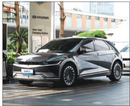
인도네시아 현대차 EV 충전소에서 현대차 아이오닉 5를 충전하고 있다.

과 충전 필요량에 맞춰 충전 용량을 선택할 수 있다. 전기차 충전 구독 서비스는 50kWh, 100kWh, 250kWh 세 가지 충전 용량으로 구성되어 있다. 설정된 충전 용량을 다 사용했을 경우에는 추가 결제를 통해 전기차 충전을 할 수 있다.