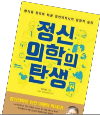
정신의학의 탄생 하지현 지음/해냄

책은 마음의 병을 고치는 학문인 '정신의학'이 발전하는 데 전환점이 된 42개의 사건을 뽑아 소개한다. '병리를 보면 생리를 더 잘 이해할 수 있다'는 말처럼 마음의 병리에 영향을 주는 요소들을 섭렵하고 역사적 흐름을 관찰하고 나면, 어떤 마음이 평온하고 건강한 것인지, 어떤 세상이 안전하고 이상적인 사회인지 나름의 그림을 그릴 수 있게 된다고 저자는 이야기한다.