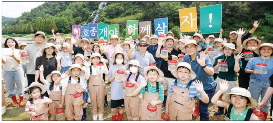
현대모비스 임직원들이 인천 미호강 일대에서 서식하는 생태 생물 종 현황 파악하고 데이터베이스를 구축하는 '생물대탐사' 활동을 진행하는 모습.

현대모비스는 최근 보건복지부와 한국사회복지협의회로부터 '2024 지역 사회공헌 우수기업'으로 선정돼 보건복지부장관상을 수상한데 이어, 행정안전부가 주관하는 '2024 대한민국 자