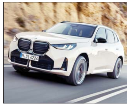
BMW 뉴 X3.

감성 품질, 안전성 및 편의 사양 부문에서 각각 8.0점(10점 만점)의 높은 점수를 받았고, 동력 성능 부문에서 7.0점을 기록했다.