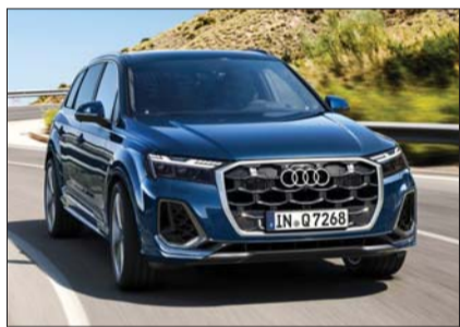
아우디 ‘더 뉴 아우디 Q7’ 주행모습.

정지연 올해의 차 선정위원장은 “더 뉴 아우디 Q7은 4년 만에 선보인 부분