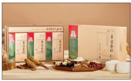
정관장 홍삼톤 골드.

정관장, 10년 간 누적매출 1조 돌파 축구선수 황희찬 '피로관리법' 유명