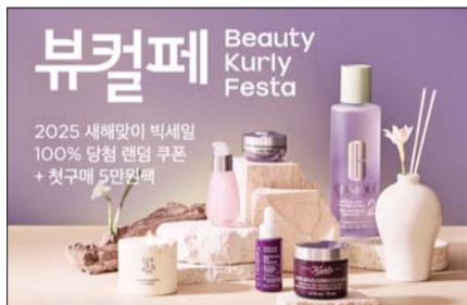
W컨셉의 설 선물대전 기획전 관련 포스터(왼쪽 위부터 시계방향), 롯데온의 'NEW 디올 플라워 가든 메이크업 컬렉션' 관련 상품, 컬리의 새해 첫 '뷰티컬리페스타' 개최 관련 포스터.

국내 e커머스 업계가 뷰티와 액세서리 제품군을 강화하며 새해 수요 공략에 나선다. 마트가 식품 위주의 새해 선물 상품에 주력하는 반면, e커머스 업체들은 뷰티와 액세서리 상품을 통해 새해 맞춤형 선물을 찾는 고객 수요를 적극적으로 공략하고 있는 것으로 풀이된다.