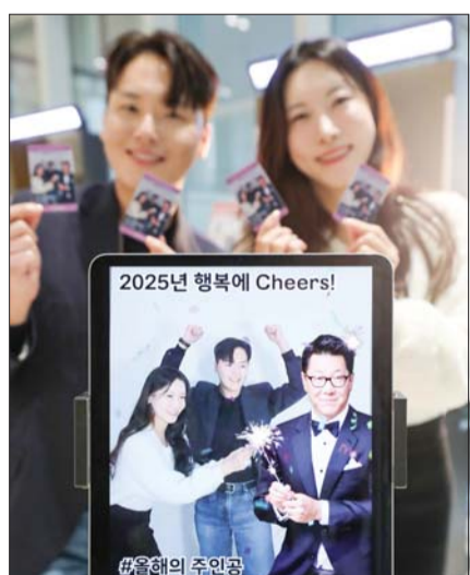
현대백화점 직원들이 AI로 구현된 정지선 현대백화점그룹 회장과 찍은 디지털 포토카드를 손에 들어보고 있는 모습.

현대백화점그룹이 지난 9일부터 이틀간 인공지능(AI) 기술로 정지선 현대백화점그룹 회장의 얼굴을 본떠 만든 가상 이미지를 바탕으로 한 디지털 포토카드 부스를 운영했다고 13일 밝혔다.