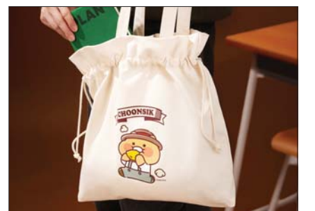
SPC 배스킨라빈스가 ‘춘식이 복조리백’ 사전 예약 행사를 진행한다.

배스킨라빈스는 ‘춘식이 복조리백’ 출시를 기념해 사전 예약 프로모션을 진행한다. 23일까지 해피포인트·해피