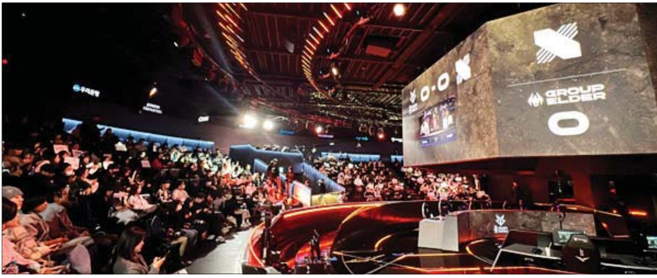
리그오브레전드 챔피언스 코리아가 2025 새시즌으로 개막했다. 지난 15일 열린 개막전에서 관중들이 LCK경기를 응원하고 있다.