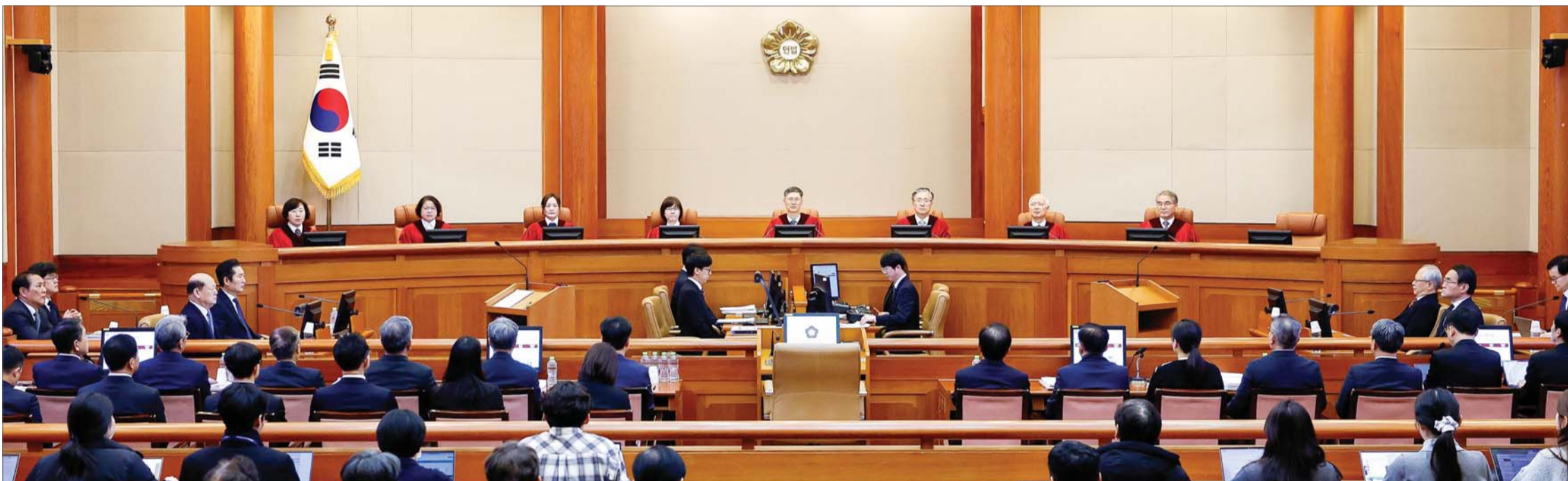
尹대통령 탄핵심판 2차 변론기일