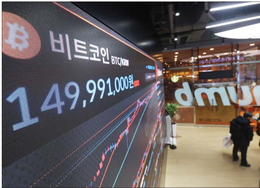
관세 전쟁 여파로 비트코인 가격이 10만 달러 밑으로 급락한 가운데 지난 3일 서울 서초구 빙셀라운지 강남점 전광판에 비트코인 시세가 표시되고 있다.

11% 하락했고, 리플(-21%), 솔라나(-10%), BNB(-11%), 도지코인(-25%), 에이다(-26%) 등 주요 알트코인이 폭락을 기록했다.