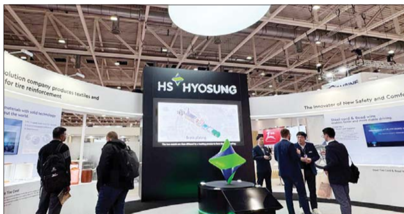
HS효성첨단소재가 4일~6일 독일 하노버에서 열리는 세계 최대 타이어 전시회인 '타이어 테크놀로지 엑스포 2025'에 참가했다.