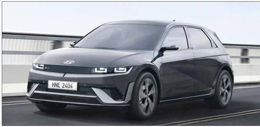
아이오닉 5 N 라인

자동차의 본고장 독일에서 신뢰성 높은 자동차 매거진인 아우토빌트의 평가 결과는 독일뿐만 아니라 유럽 소비자들 사이에서 차를 구매할 때 중요한 판단 기준이 된다.