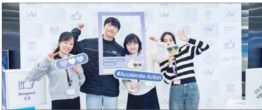
삼성바이오로직스 임직원들이 '세계 여성의 날' 기념하는 행사에 참여하고 있다.