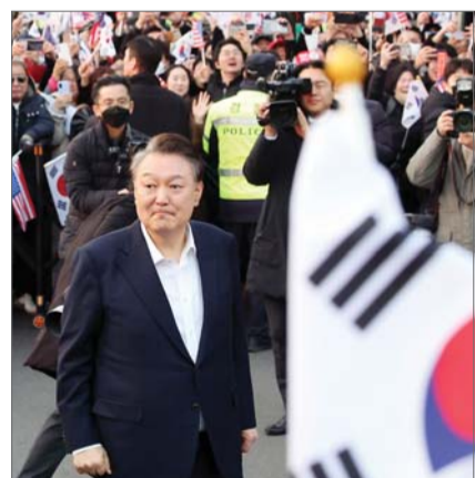
석방된 윤석열 대통령이 8일 오후 서울 용산구 한남동 관저 입구에서 지지자들에게 인사하고 있다.

9일 법조계에 따르면 헌재는 지난달 25일 윤 대통령 탄핵심판 변론 절차를 종결한 후, 휴일을 제외하고 매일 평의를 열어 사건 쟁점을 검토하고 있다.