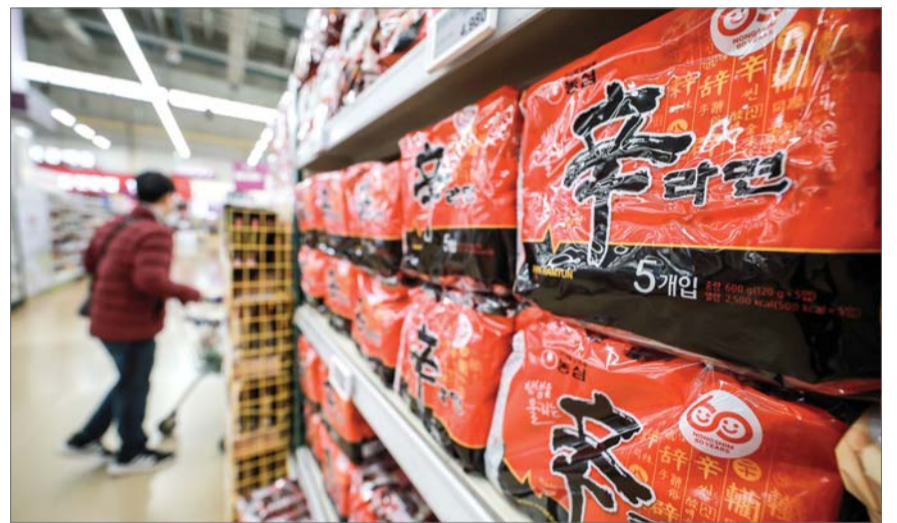
9일 서울 시내 대형마트에 신라면이 진열되어 있다. 원재료 가격 및 제반 비용 인상, 고회율 등으로 식품업계 원가 압박이 심화되면서 먹거리 가격의 줄인상이 이어지고 있다. 농심은 오는 17일부터 신라면과 새우깡의 가격을 조정하고, 총 56개 라면과 스낵 17개 브랜드의 출고가를 평균 7.2% 인상한다.

국제 곡물 가격도 오름세다. 곡물 가격지수는 0.7% 상승한 112.6을 기록했다. 특히 밀 가격은 러시아의 공급 부족