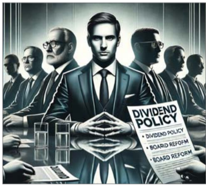
첫GPT로 생성한 행동주의 펀드 이미지.

얼라인파트너스와 코웨이측도 대립각을 세우고 있다. 얼라인파트너스는 주총 의결권 대리인을 통상 인원보다 많은 20명을 신청한 것으로 알려졌다. 이에 맞서 코웨이는 대전지방법원 공주지원에 주총 검사인 선임을 신청했다. 머스트자산운용은 영풍 지분 3% 이