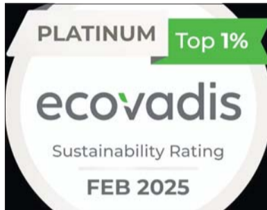
LG디스플레이가 획득한 에코바디스의 플래티넘 메달 사진.

에코바디스는 2007년 프랑스 파리에서 설립된 글로벌 ESG 평가 기관이다. 세계 180여개국 15만 개 이상의 기업을 ▲환경 ▲노동·인