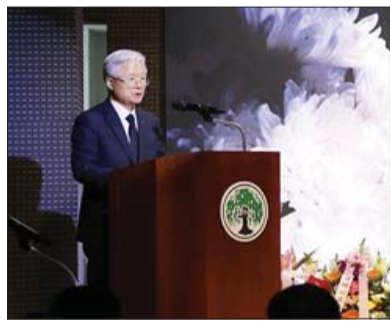
유한양행과 유한재단, 유한학원이 11일 오전 경기도 부천시 유한대학에 위치한 유재라관 대강당에서 유일한 박사 제54주기 추모식을 가졌다.

이날 추모식은 유족 및 조옥제 사장을 비롯한 유한양행 임직원, 유한재단과 유한학원 관계자, 유한가족 사임직원, 유한공고 및 대학 재학생 등 300여 명이 참석한 가운데 엄숙히 거행됐다. 추모식에 앞서 유한양행 임직원