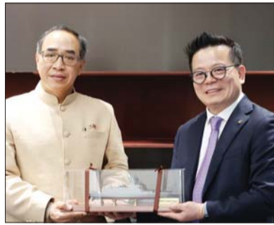
10일 한화오션 서울사무소에서 타니 썬랏(Tanee Sangrat) 주한 태국 대사(왼쪽)와 한화오션 특수선사업부장 어성철 사장이 협력 회의를 마친 뒤 기념촬영을 하고 있다.

한화오션이 호위함 수출로 인연을 맺은 태국 정부와 상호 신뢰를 바탕으로 한 '지속 가능한 협력'을 논의했다. 한화오션은 지난 10일 서울사무소에서 특수선사업부장 어성철 사장과 회사 관계자들이 타니 썬랏(Tanee Sangrat) 주한 태국 대사(왼쪽)와 한화오션 특수선사업부장 어성철 사장이 협력 회의를 마친 뒤 기념촬영을 하고 있다. 조선 산업의 경쟁력을 높이고 현지 조선소와의 협업을 확대하겠다는 장기 비전을 제시했다. /양성운 기자