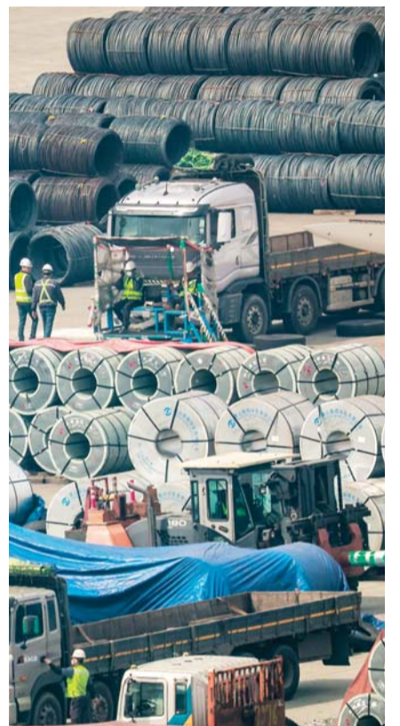
도널드 트럼프 미국 대통령이 수입산 철강과 알루미늄에 부과한 25% 관세가 한국시간으로 12일 오후 1시부터 발효됐다. 한국 산업에 직접적으로 영향을 미치는 것은 이번 철강, 알루미늄 관세가 처음이다. 지난 12일 경기 평택시 평택항에 철강 제품들이 쌓여 있다.