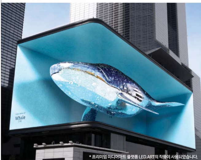
* 프리미엄 미디어아트 플랫폼 LED.ART의 작정이 사용되었습니다.