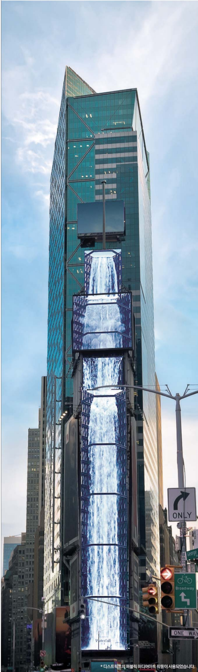
* 디스트릭트의 픽셀릭 미디어트 작정이 사용되었습니다.