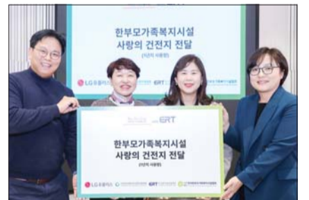
LG U+, 한가함에 건전지 1.7만개 기부

세부내용으로 ▲ 설비투자 촉진 및 정책자금 지원 ▲ 수출경쟁력 강화 ▲ 전문 인력 양성 ▲ 지속가능 경영을 위한 ESG·탄소중립 실현 등에 적극 협력하기로 했다. /김승호 기자 bada@