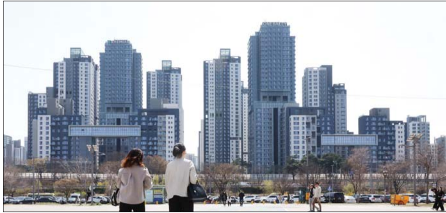
조기 대선으로 아파트 분양이 뒤로 미뤄질 전망이다. 서울 아파트 전경.